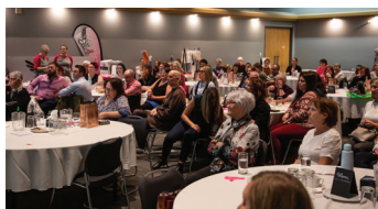
Colloque régional sur le cancer du sein 2022

Au sein des femmes est fier de vous présenter ce guide qui vous dressera une liste non-exhaustive des services utiles en cas de diagnostic de cancer du sein ou même pour pallier aux séquelles après la maladie. Prenez note que si vous êtes présentement en suivi en oncologie, il est fortement recommandé de valider toute démarche de traitement complémentaire avec votre équipe soignante.