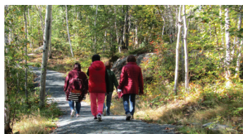
Club de marche 2021